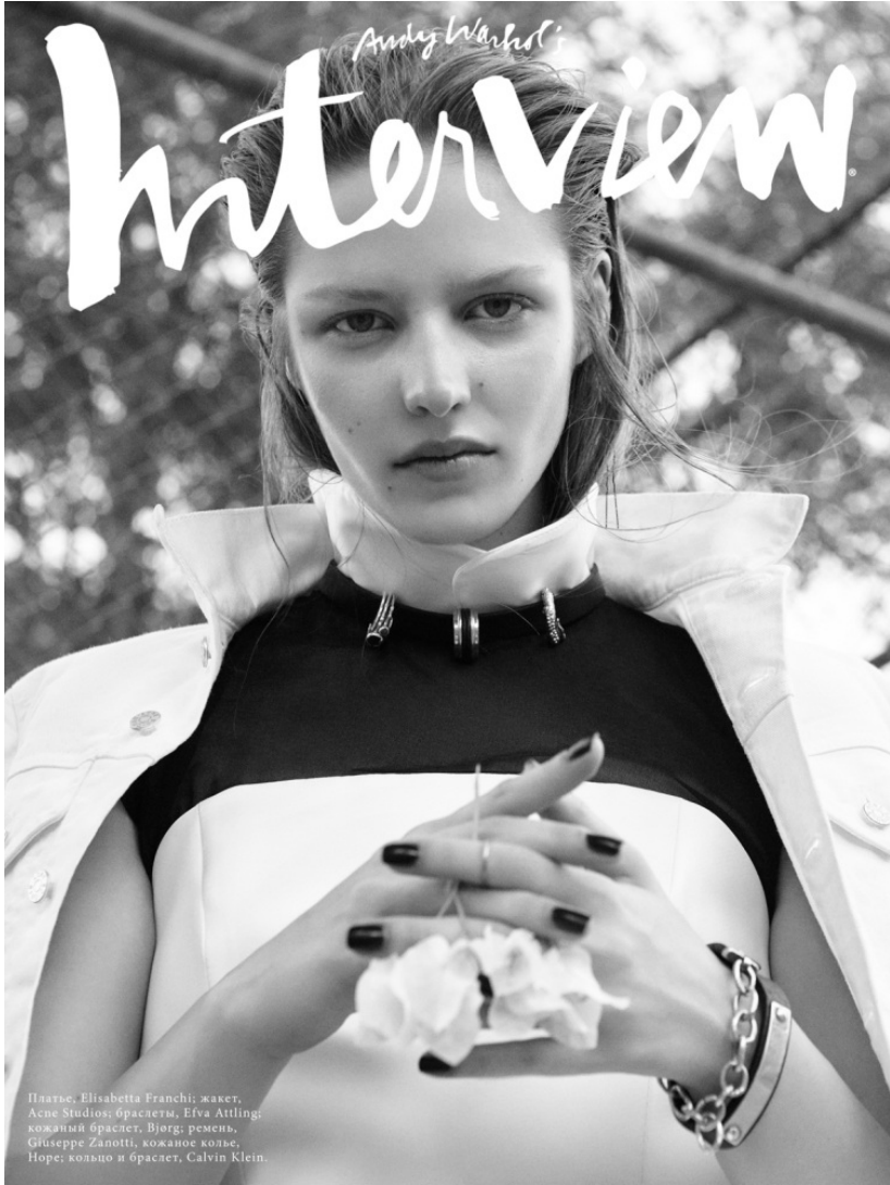
Платье, Elisabetta Franchi; жакет, Asse Studios; браслеты, Elve Atling; кожаный браслет, Bjorg; ремешок, Giuseppe Zanotti; кожаное кольцо, Hore; кольцо и браслет, Calvin Klein.